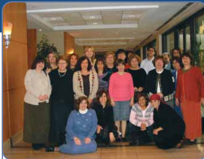
משתתפי מכון תל עם ד (חלק שלישי) ניסוי מעצב, מונטריאול Participants in the TaL AM 4 Pilot Test Institute (Part 3), Montreal