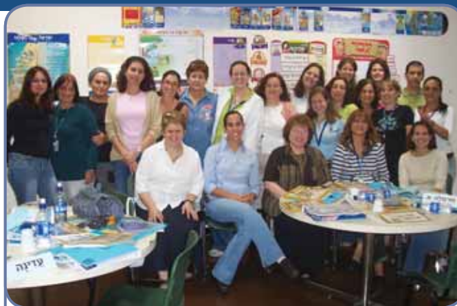
משתתפי מכון תל עם א-ב (חלק ראשון), קראקס Participants in the TaL AM 1 & 2 Training Institute (Part I), Caracas

For additional information please visit our website www.talam.org or send us an e-mail talam@talam.org