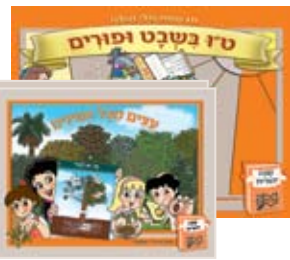
2 ספרונים מונחים 2 guided books