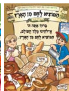
לוחות ברכות Blessing Posters

חומרים שיצאו לאור בחודשים הקרובים: Material to be published in the coming months: