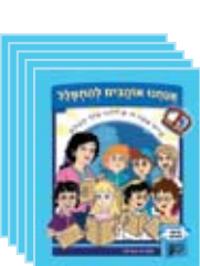
5 ספרוני ספריה 5 library books