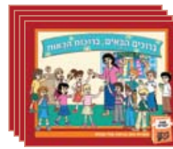
4 ספרונים מונחים 4 guided books