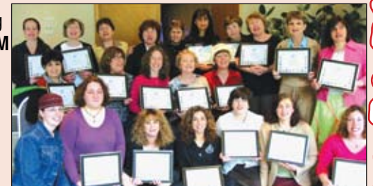
המורות המנסות של תל עם ג' במכון המסכם, מונטריאול, אייר תשס"ה Grade 3 Pilot testing teachers at the TaL AM Summative Institute, Montreal, May 2005

The TaL AM team is currently working on rewriting TaL AM for Grade 3 . We would like to thank our pilot testing teachers, whose experience and input helped improve the new program.