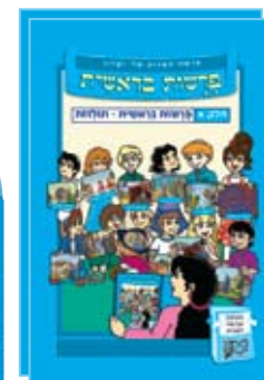
2 ספרים גדולים 2 big books