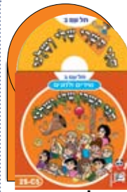
2 תקליטורים 2 CDs