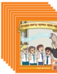
7 ספרוני ספריה 7 library books