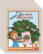
5 ספרוני ספריה 5 library books