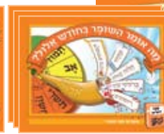
3 ספרונים מונחים 3 guided books